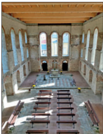
Blick von der Orgelempore in die Kirche

Auch in dieser Ausgabe der Mochauer Rundschau möchten wir Sie wieder über den Fortgang unseres Bauvorhabens informieren. Es ist einiges geschehen: Außen ist neuer Putz aufgebracht worden, eine recht gelungene Synthese aus festen Altputzresten und farblich abgestimmtem frischem Putz, als Auflage der Denkmalpflege. Für den Innenraum waren die erforderlichen finanziellen Mittel wegen notwendiger Mehraufwendungen (vor allem für die Turmstabilisierung) nicht mehr vorhanden, so dass dort nur das Notwendigste geputzt werden konnte. Nicht unbedingt zum Nachteil für den Raumeindruck, wie viele Besuche-