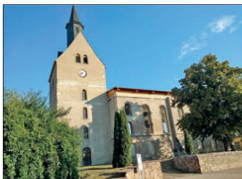
Sommerkirche im September 2019

rinnen und Besucher am Tag des offenen Denkmals feststellten. Das bleibt also – wie so vieles andere auch – eine Aufgabe für später. Wir haben ja jetzt das vor Nässe und weiterem Verfall schützende Dach! Damit sind aber die Arbeiten an unserer Kirche noch keineswegs abgeschlossen. Innen und außen