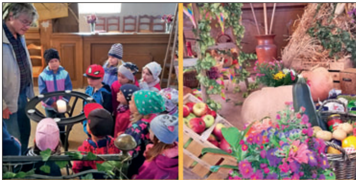
Erntedankfest in der Kirche in Rüsseina